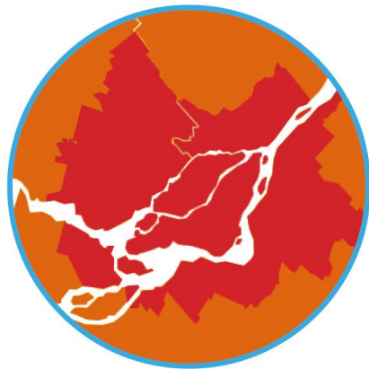
Montréal et environs